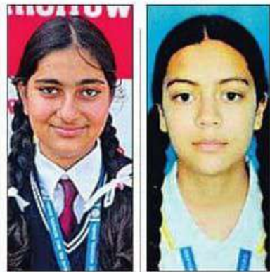
अरिक्का, नीलम पब्लिक सीसे स्कूल बौहडू हमीरपुर अलीशा, ऑक्सफोर्ड स्कूल कोटली मंडी