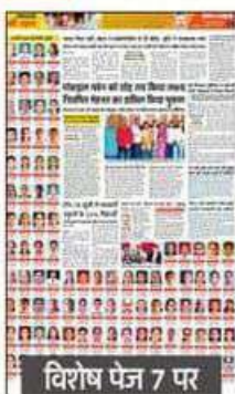
विशेष पेज 7 पर

टॉप टेन में 107 विद्यार्थी 83 छात्राएं और 24 छात्र