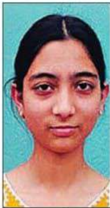
1st अनमोल एवीएम सीनियर सेकेंडरी स्कूल पाहड़ा, कांगड़ा