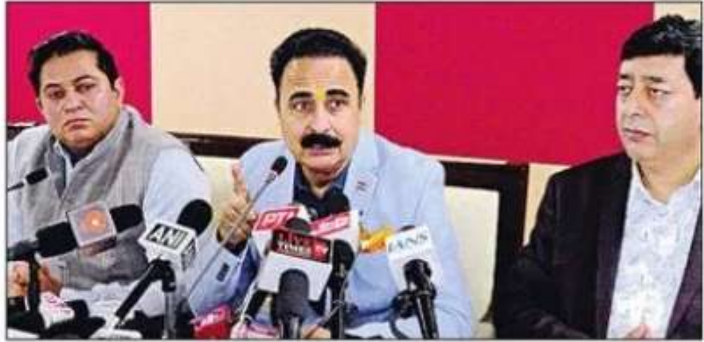
दसवीं का परिणाम घोषित करते शिक्षा बोर्ड के अध्यक्ष। अमर उजाला

सरकारी स्कूलों में पढ़ने वाले विद्यार्थियों की संख्या 70,346 थी, जबकि इसके विपरीत निजी स्कूलों से परीक्षा देने वाले विद्यार्थियों की संख्या 22,830 थी, जोकि कुल विद्यार्थियों की संख्या का 24.37 फीसदी है। बावजूद 10वीं कक्षा के वार्षिक परिणाम में प्रदेश को दूसरे नंबर का टॉपर देकर सूबे के सरकारी स्कूल टॉप-10 सूची में पिछड़ गए हैं। दूसरे रैंक पर तीन,