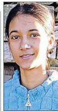
पूर्णिमा, कन्या सीनियर सेकेंडरी स्कूल बिलासपुर